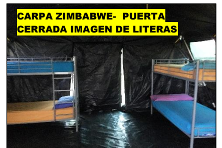
CARPA ZIMBABWE- PUERTA CERRADA IMAGEN DE LITERAS

AULA DE LA NATURALEZA LA ALPUJARRA S.L. CORTIJO DÑA ÁNGELES-ALBAYAR Nº 1; 18451 BÉRCHULES (GRANADA) CIF: B-18638247; TLF: 608.842224; info@vivetuaventura.com