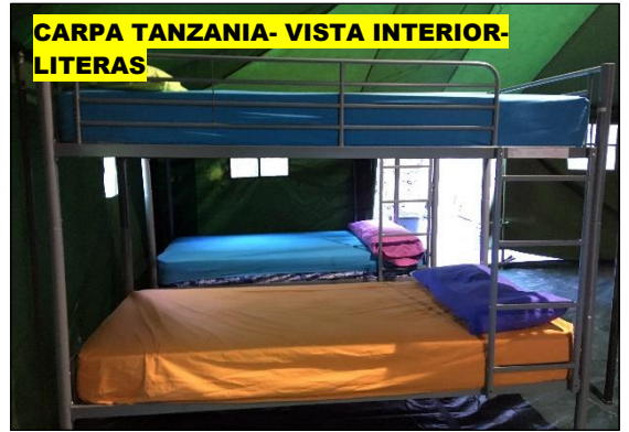
CARPA TANZANIA- VISTA INTERIOR- LITERAS