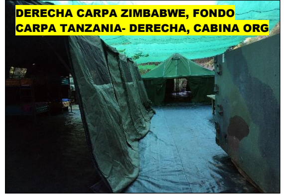
DERECHA CARPA ZIMBABWE, FONDO CARPA TANZANIA- DERECHA, CABINA ORG